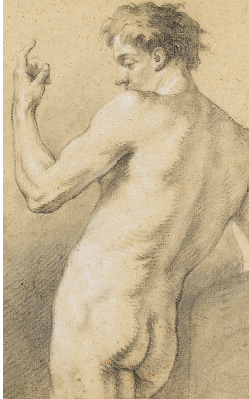
MICHEL-FRANÇOIS DANDRÉ-BARDON, Männlicher Rückenakt mit angewinkeltem linkem Arm, um 1725

Alle Preise gelten zzgl. Eintritt, wenn nicht anders angegeben.