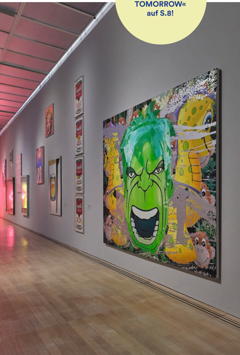
Jeff Koons, Hulk (Jungle), 2005, Staatsgalerie Stuttgart, Leihgabe der Freunde der Staatsgalerie seit 2005, © Jeff Koons