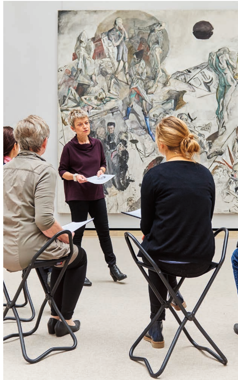
MAX BECKMANN, Auferstehung, 1916, Staatsgalerie Stuttgart, erworben 1964 mit Lotto-Mitteln

Alle Preise gelten zzgl. Eintritt, wenn nicht anders angegeben.