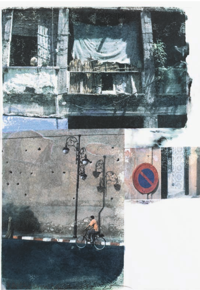
ROBERT RAUSCHENBERG, Mensch ärgere dich nicht, 2000, Staatsgalerie Stuttgart, Graphische Sammlung, Leihgabe 2002 Freunde der Staatsgalerie Stuttgart e.V., Konrad Kohlhammer-Stiftung, © Robert Rauschenberg Foundation / VG Bild-Kunst, Bonn 2026