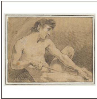
Sitzender männlicher Akt mit angezogenem linkem Knie und Seil in den Händen