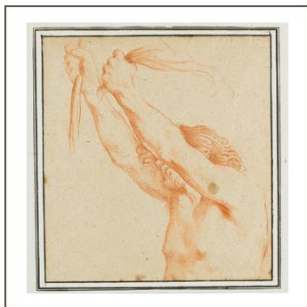
Oberkörper eines männlichen Aktes mit erhobenen Armen und Seilenden in den Händen