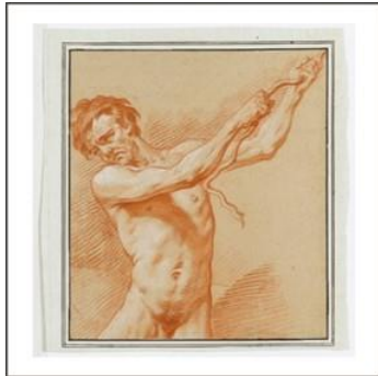
Männlicher Akt sich an einem Seil haltend