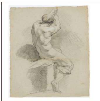
Sitzende männliche Aktfigur in Rückansicht mit erhobenen Armen