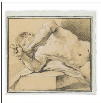
Auf einem Steinblock liegender männlicher Halbakt, mit der einen Hand seinen Unterarm packend