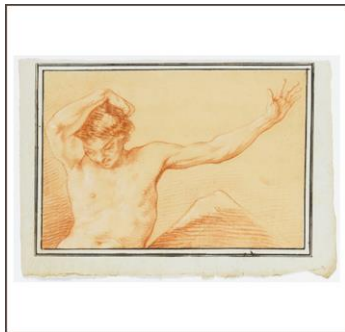
Männlicher Halbakt mit ausgestrecktem linkem Arm