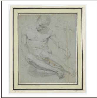
Studie eines sitzenden männlichen Aktes