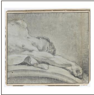
Oberkörper eines auf einem Rundbogen liegenden nackten Mannes mit ausgestrecktem Arm