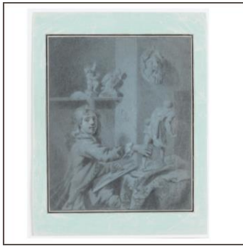
Porträt eines Malschülers bei der Arbeit mit Gipsmodellen