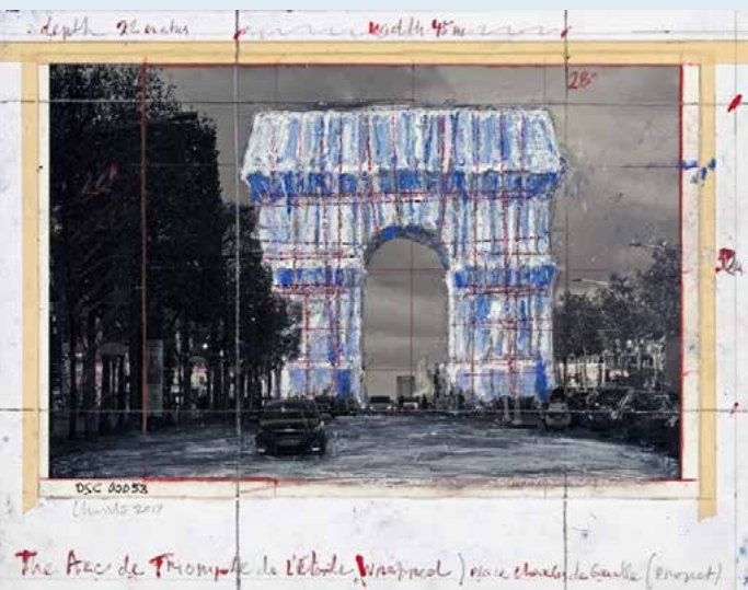
CHRISTO AND JEANNE-CLAUDE, L'Arc de Triomphe, wrapped (Project for Paris) Place d'Étoile, Collage by Christo 2017, photographed by Wolfgang Volz, Foto: André Grossman