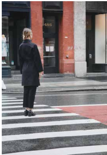
BARBARA PROBST, #152: N.Y.C., Broadway und Broome Street, 18.04.20, 10:46 Uhr, 2020, Staatsgalerie Stuttgart, Graphische Sammlung, © VG Bild-Kunst, Bonn 2021

Aktuelles zu Covid-19 und den Hygiene- und Abstandsregeln finden Sie unter staatsgalerie.de