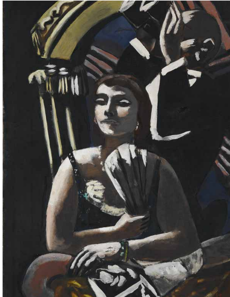
MAX BECKMANN, Die Loge, 1928, Staatsgalerie Stuttgart

Die Veranstaltung findet digital als Zoom-Konferenz statt, die Teilnahme ist kostenlos. Bitte melden Sie sich über unseren Kalender an. Wir empfehlen Ihnen, sich für den gesamten Kurs anzumelden.