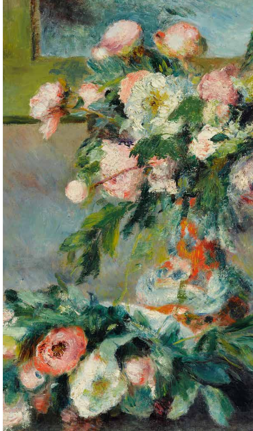
PIERRE-AUGUSTE RENOIR, Päonien, 1878, Detail, Leihgabe aus Privatbesitz, Foto © Staatsgalerie Stuttgart

Aktuelles zu Covid-19 und den Hygiene- und Abstandsregeln finden Sie unter staatsgalerie.de