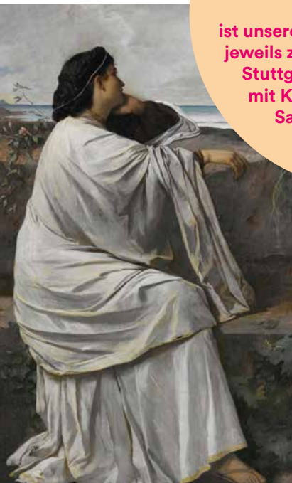
ANSELM FEUERBACH, Iphigenie, 1871, Staatsgalerie Stuttgart

ist unsere Video-Reihe bei der sich jeweils zwei Kunstschaffende aus Stuttgart auf ein Rendezvous mit Kunstwerken in unserer Sammlung einlassen.