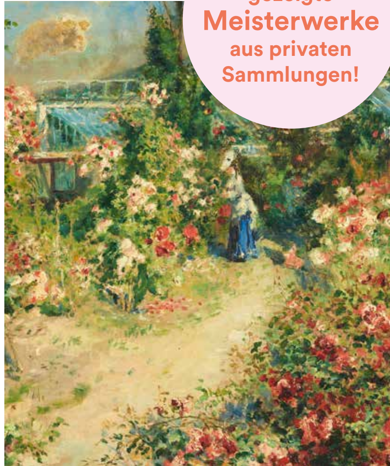
PIERRE-AUGUSTE RENOIR, Das Gewächshaus (La Serre | The Greenhouse), um 1876, Leihgabe aus Privatbesitz, Foto: © Staatsgalerie Stuttgart

Noch nie gezeigte Meisterwerke aus privaten Sammlungen!