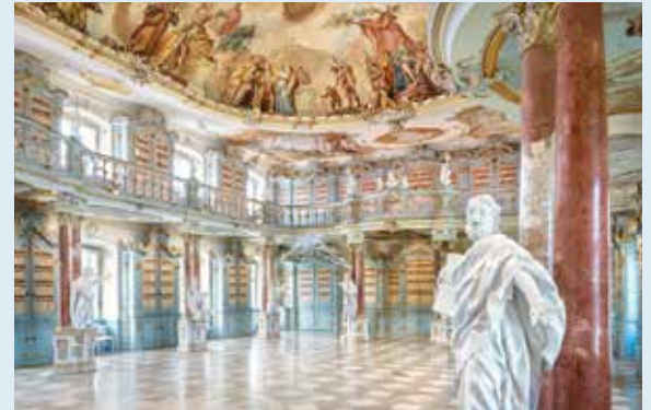
Bibliothek, Kloster Schussenried

Anmeldung und weitere Informationen unter: freunde-der-staatsgalerie.de