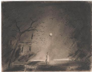
Fred Uhlman, Landschaft mit Erhängtem (aus »Captivity«), 1940, Staatsgalerie Stuttgart, © The Estate of Fred Uhlman