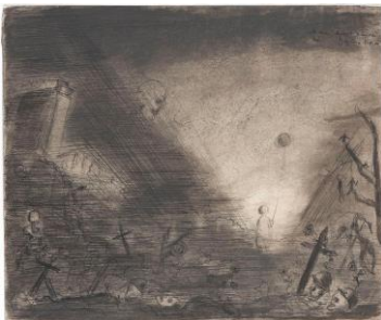
Fred Uhlman, Schlachtfeld (aus »Captivity«), 1940, Staatsgalerie Stuttgart, © The Estate of Fred Uhlman