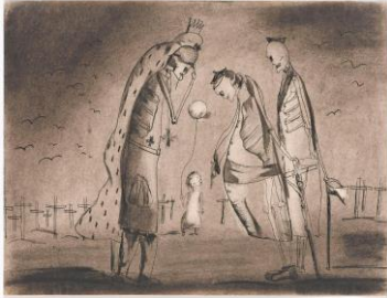
Fred Uhlman, Die toten Feldherren (aus »Captivity«), 1940, Staatsgalerie Stuttgart, © The Estate of Fred Uhlman