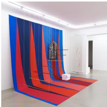
Ulla von Brandenburg, Große Bühne, 2021, © Courtesy the artist and Meyer Riegger Berlin Karlsruhe