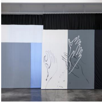
Kalin Lindena, Ohne Titel (Bühne), 2014, Staatsgalerie Stuttgart, Installationsaufnahmen aus dem Kunstverein Reutlingen, © Kalin Lindena & Galerie Nagel, Foto: Frank Kleinbach