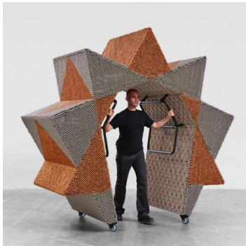
Haegue Yang, Sonic Gate – Law of Nine, Part of Handles, 2019, © Courtesy of the artist, Foto: Holger Niehaus