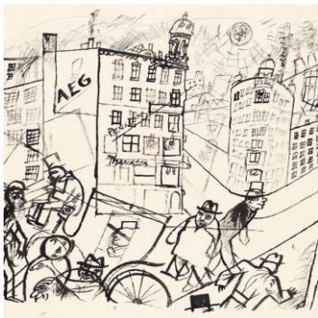
George Grosz, Großstadtstraße mit Kutsche, um 1920, Staatsgalerie Stuttgart, Graphische Sammlung © Estate of George Grosz, Princeton, N.J. / VG Bild-Kunst, Bonn 2022