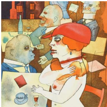
George Grosz, Schönheit, dich will ich preisen (Blatt 3 in: Ecce Homo), 1919 (1923), Staatsgalerie Stuttgart, Graphische Sammlung