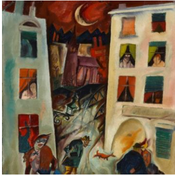
George Grosz, Die Straße, 1915, Staatsgalerie Stuttgart © Estate of George Grosz, Princeton, N.J. / VG Bild-Kunst, Bonn 2022