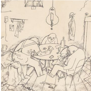
George Grosz, Apachen (Blatt 58 in: Ecce Homo), 1917, Sammlung Judin, Berlin