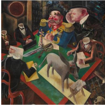
George Grosz, Sonnenfinsternis, 1926, The Heckscher Museum of Art, New York © Estate of George Grosz, Princeton, N.J. / VG Bild-Kunst, Bonn 2022