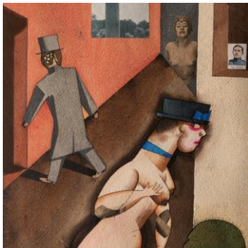
George Grosz, Tatlinistischer Plan, 1920, Museo Nacional Thyssen-Bornemisza, Madrid © Estate of George Grosz, Princeton, N.J. / VG Bild-Kunst, Bonn 2022