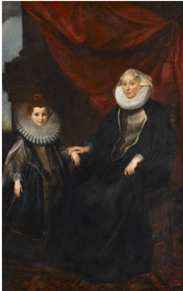
PETER PAUL RUBENS, Geronima Spinola Spinola und ihre Enkelin Maria Giovanna Serra, um 1605/06, Staatsgalerie Stuttgart