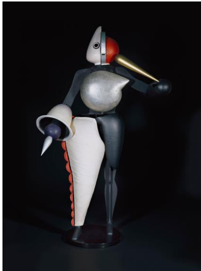
OSKAR SCHLEMMER, Das Triadische Ballett: Der Abstrakte, 1922, Staatsgalerie Stuttgart